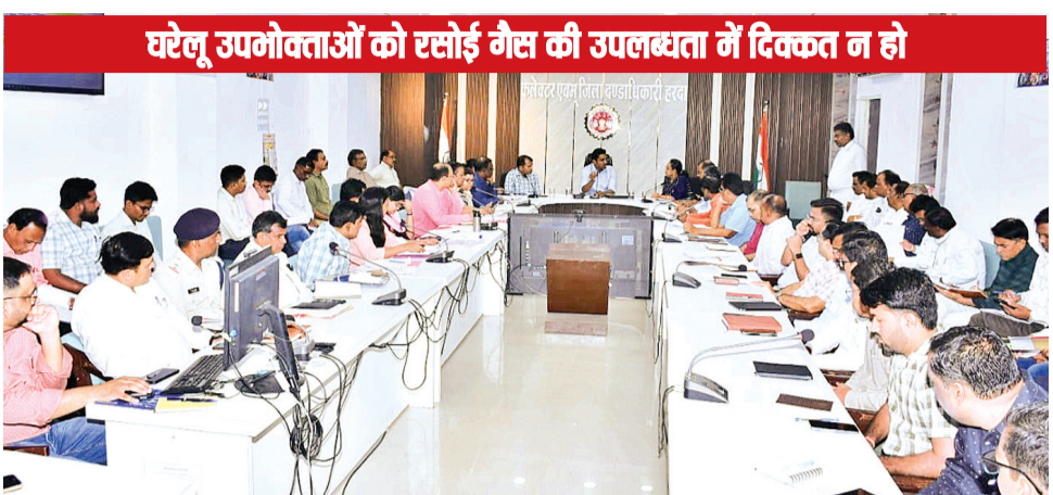
घरेलू उपभोक्ताओं को रसोई गैस की उपलब्धता में दिक्कत न हो