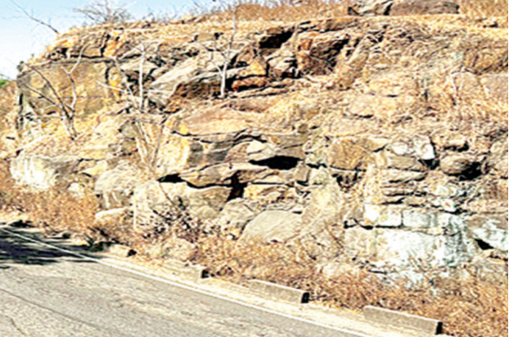
हरिभूमि न्यूज | झिरन्या

सीमावर्ती महाराष्ट्र के सघन वनक्षेत्र में विकास के नाम पर वन्य प्राणियों को बुरी नजर लग गई है। वहीं प्रकृति की गोद में उनके स्वच्छन्द रूप से विचरण एवं नैसर्गिक-जीवन पर खतरा मंडरा रहा है। जबकि चित्तौड़गढ़-मुसावल राष्ट्रीय मार्ग के उन्नयन-कार्य में सघन वन क्षेत्र की खनिज-संपदा को भी क्षति की आशंका है। चित्तौड़गढ़-मुसावल राष्ट्रीय मार्ग निर्माण के लिए एजेंसी एम.एस.खुराना इंजीनियरिंग लिमिटेड अहमदाबाद वन विभाग एवं नैसर्गिक-जीवन पर खतरा मंडरा रहा है। जबकि चित्तौड़गढ़-मुसावल राष्ट्रीय मार्ग के उन्नयन-कार्य में सघन वन क्षेत्र की खनिज-संपदा को भी क्षति की आशंका है। चित्तौड़गढ़-मुसावल राष्ट्रीय मार्ग निर्माण के लिए एजेंसी एम.एस.खुराना इंजीनियरिंग लिमिटेड अहमदाबाद वन विभाग एवं नैसर्गिक-जीवन पर खतरा मंडरा रहा है। जबकि चित्तौड़गढ़-मुसावल राष्ट्रीय मार्ग के उन्नयन-कार्य में सघन वन क्षेत्र की खनिज-संपदा को भी क्षति की आशंका है। चित्तौड़गढ़-मुसावल राष्ट्रीय मार्ग निर्माण के लिए एजेंसी एम.एस.खुराना इंजीनियरिंग लिमिटेड अहमदाबाद वन विभाग एवं नैसर्गिक-जीवन पर खतरा मंडरा रहा है।