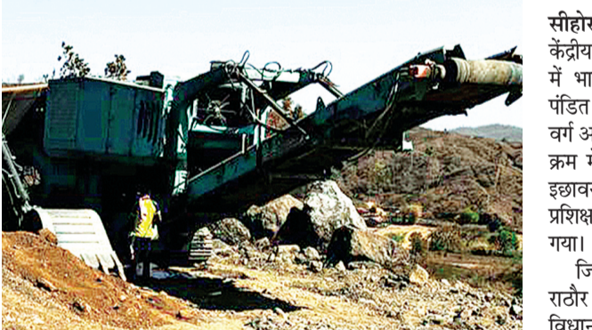
इनका कहना है

सीमावर्ती महाराष्ट्र के सघन वनक्षेत्र में विकास के नाम पर वन्य प्राणियों को बुरी नजर लग गई है। वहीं प्रकृति की गोद में उनके स्वच्छन्द रूप से विचरण एवं नैसर्गिक-जीवन पर खतरा मंडरा रहा है। जबकि चित्तौड़गढ़-मुसावल राष्ट्रीय मार्ग के उन्नयन-कार्य में सघन वन क्षेत्र की खनिज-संपदा को भी क्षति की आशंका है। चित्तौड़गढ़-मुसावल राष्ट्रीय मार्ग निर्माण के लिए एजेंसी एम.एस.खुराना इंजीनियरिंग लिमिटेड अहमदाबाद वन विभाग एवं नैसर्गिक-जीवन पर खतरा मंडरा रहा है। जबकि चित्तौड़गढ़-मुसावल राष्ट्रीय मार्ग के उन्नयन-कार्य में सघन वन क्षेत्र की खनिज-संपदा को भी क्षति की आशंका है। चित्तौड़गढ़-मुसावल राष्ट्रीय मार्ग निर्माण के लिए एजेंसी एम.एस.खुराना इंजीनियरिंग लिमिटेड अहमदाबाद वन विभाग एवं नैसर्गिक-जीवन पर खतरा मंडरा रहा है। जबकि चित्तौड़गढ़-मुसावल राष्ट्रीय मार्ग के उन्नयन-कार्य में सघन वन क्षेत्र की खनिज-संपदा को भी क्षति की आशंका है। चित्तौड़गढ़-मुसावल राष्ट्रीय मार्ग निर्माण के लिए एजेंसी एम.एस.खुराना इंजीनियरिंग लिमिटेड अहमदाबाद वन विभाग एवं नैसर्गिक-जीवन पर खतरा मंडरा रहा है।