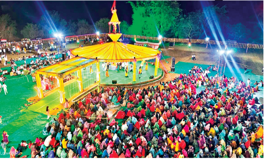
हरिभूमि न्यूज | हरदा

ग्राम बालागांव में आयोजित गणगौर महोत्सव पूरे उत्साह और श्रद्धा के साथ मनाया जा रहा है। महोत्सव के चतुर्थ दिवस विभिन्न मंडलों द्वारा आकर्षक प्रस्तुतियां दी गईं, जिन्हें देखने के लिए गांव सहित आसपास के क्षेत्रों से बड़ी संख्या में ग्रामीण और महिलाएं उपस्थित रहें। दिन के समय माता-बहनों एवं गोरनी बाईं द्वारा आम के पेड़ के नीचे पारंपरिक रीति-रिवाजों के साथ झालरे दिए गए। इस दौरान आसपास से आई महिला मंडलियों ने भी सुंदर प्रस्तुति देकर माहौल को भक्तिमय बना दिया। वहीं रात्रि में आयोजित